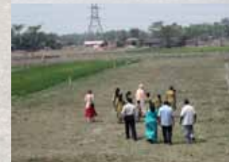
The land where the center is being built.