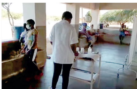
Gravida kvinnor och mammor med sina barn på besök på hälsokliniken i Muabsa.

Åren 2002 – 2004 genomförde Arken detta projekt för att ge byn hälsovård, brunnar och skolutbildning.